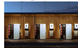
水素エネルギー貯蔵システム

●ジェトロ対日投資・ビジネスサポートセンター(IBSC)は、企業招へい、ビジネスマッチング、専門家コンサルテーション、マーケットレポート、人材派遣業者の紹介、国内VC及びCVCのリスト提供等の多面的な支援を実施。