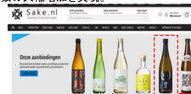
Taste of Sakeのジャパンモール特設サイト