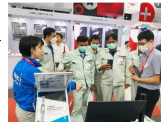
海外展示会での商談