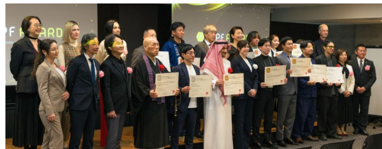
「クールジャパン・プラットフォームアワード2026」 表彰式の様子

官民一体となってクールジャパン戦略を効果的に推進することにより、クールジャパン関連産業の海外展開や日本ファンの拡大を図るとともに、経済成長につなげることが必要。