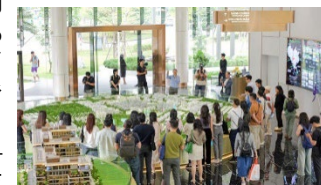
スタートアップエコシステムの構築

●ジェトロが2023年11月に開催した「Innova Vietnam-Japan Fast Track Pitch 2023」を契機に協議がはじまり、J-Bridge等を通じて両社の協業を後押しし、協業が実現。