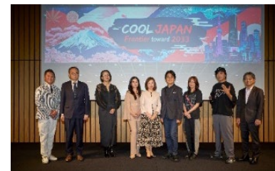
CJPF総会 「クールジャパンフロンティア toward 2033」の様子