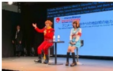
大阪・関西万博 「クールジャパンショーケース アニメ・マンガツーリズム フェスティバル」の様子