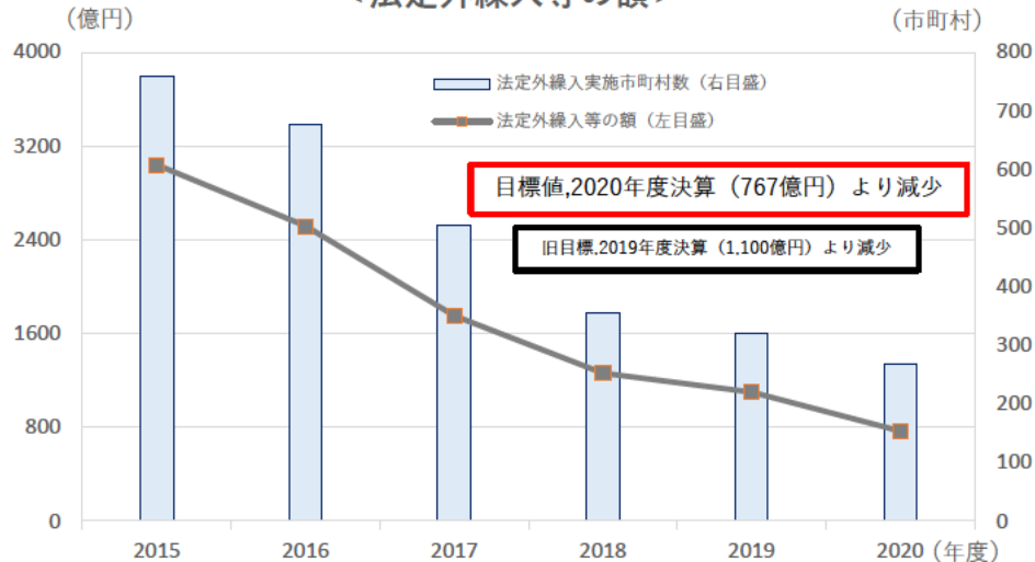
< 法定外繰入等の額 >

(備考) 1 厚生労働省「地域包括ケア「見える化」システム」より作成。 2 サービス種別ごとに、全国平均値を上回る都道府県の「[平均値との差]の平均」÷「平均値」を算出。