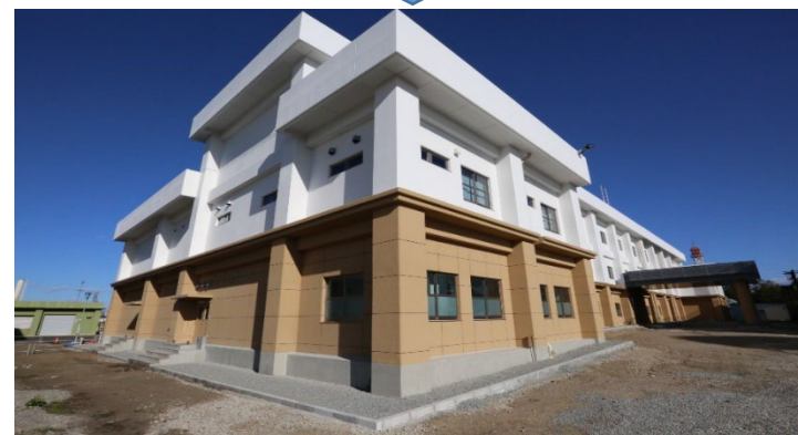
耐震性能を備えた新設庁舎(R4年度建設)