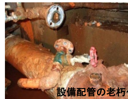
設備配管の老朽化