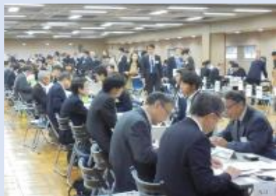
▲東京商工会議所主催 当日の様子

○新卒者採用に向けた人脈構築の場を提供し、会員企業における学内説明会・学生の就職活動状況の把握等、情報収集に役立てていただいている。