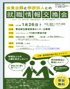
▲東京商工会議所主催リーフレット