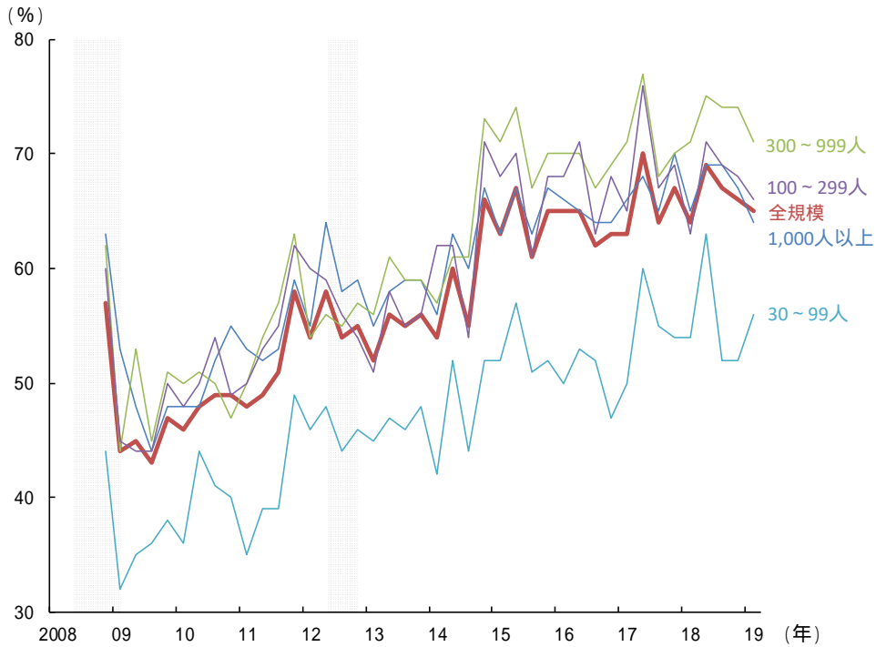
図2 中途採用の実績がある事業所の割合（規模別）