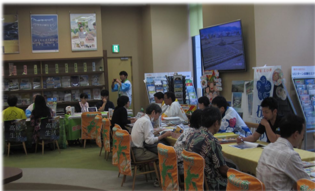
(移住フェアの様様)