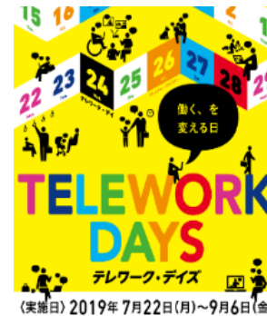
テレワーク・デイズ等の広報 (テレワーク・デイズ2019ポスター)