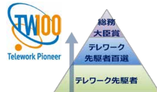
先進事例の収集・表彰 (テレワーク先駆者百選・総務大臣賞)