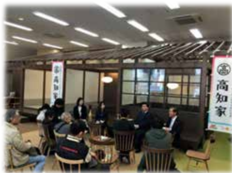
(移住フェアの様様)