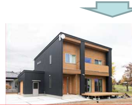
子育て世帯が住まいとして活用