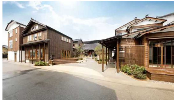
拠点施設(温浴施設、レストラン、事務所等)