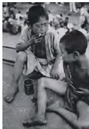
東京都・上野駅 昭和21年(1946) | 林忠彦 《煙草をくゆらす戦災孤児》