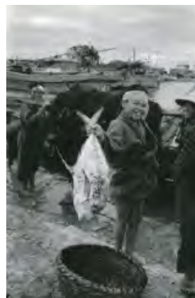
沖縄県・糸満漁港 昭和34年(1959) | 井上孝治 《大きな魚が捕れた》