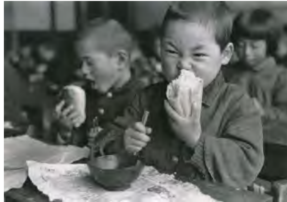
長野県・会地村 | 昭和28年(1953) | 熊谷元一 《コッペパンをかじる》