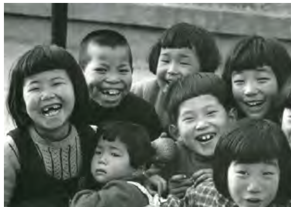
東京都・江東 | 昭和28年(1953) | 土門拳《笑う子》