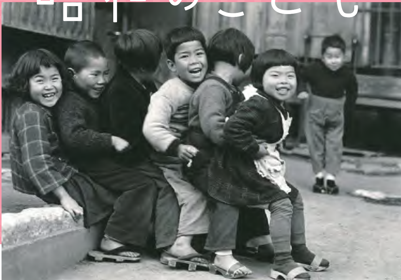
東京都・江東 | 昭和28年(1953) | 土門拳《おしくらまんじゅう》