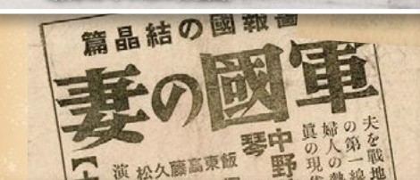
昭和34年4月の青雲館(スカラ座)