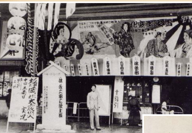
昭和10年9月の青雲館

昭和元年(1926年)12月31日岐阜ロイヤル劇場の前身青雲館がオープン以来、改築や改修及び館名変更を経て昭和52年(1977年)より現在のロイヤル劇場の姿に開館以来100年間にわたる青雲館の全上映番組をチラシや新聞広告から調査年代順の上映番組を横軸に映画や映画館の移り変わりを物語風に辿る岐阜でロケされた映画や岐阜にゆかりのある映画人を紹介