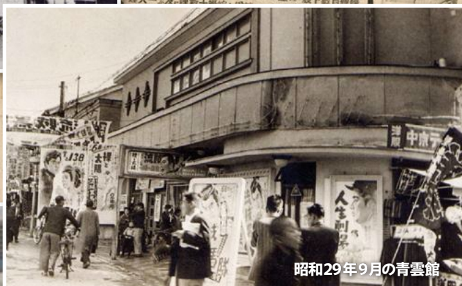
昭和29年9月の青雲館