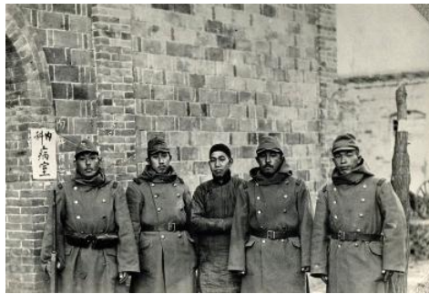
昭和12(1937)年 名古屋砲兵第三聯隊に応召 石家荘の野戦予備病院に収容