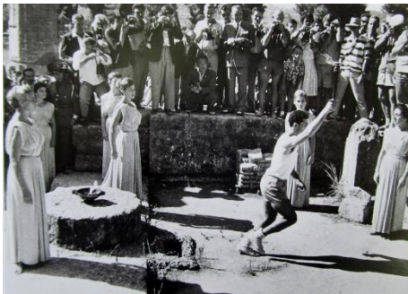
昭和35(1960)年 ギリシャで聖火を取材 (ローマオリンピック)