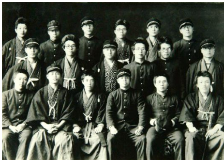
昭和4(1929)年 四高柔道部主将となる