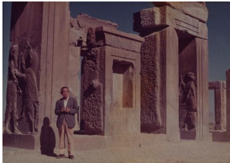
昭和48(1973)年 イラン、ペルセポリスにて