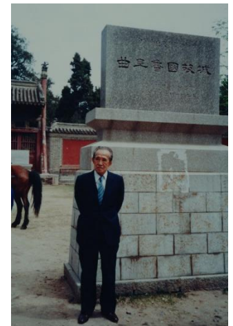
昭和63(1988)年 曲阜魯国故城遺跡碑の前