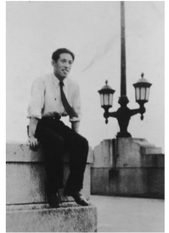
大阪毎日新聞社時代