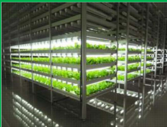
人工光型植物工場の例(株みらい)

※ 植物工場の研究・開発、設計 ・施工請負等の事業を行っている株みらいとの協働。