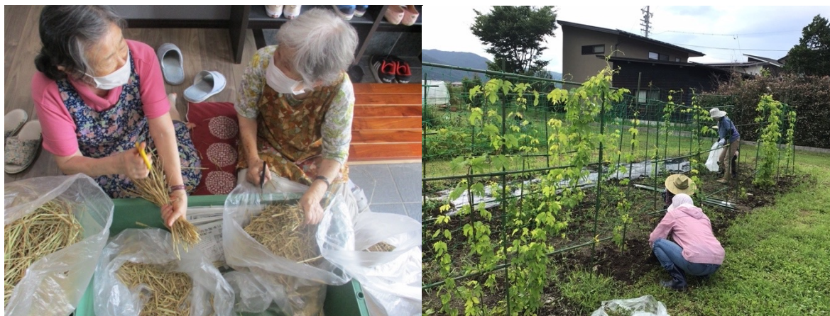
認知症のある人たちが、自分たちでホップを栽培