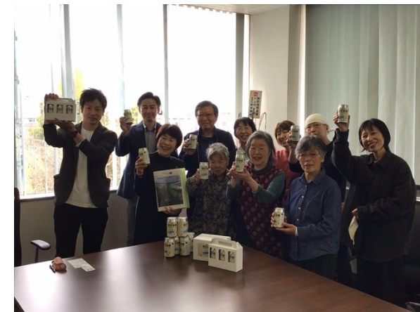
ビールをつくって、市長に届けました（長野県諏訪市）