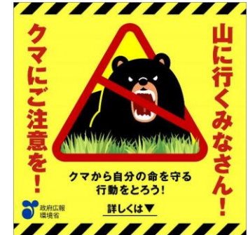
(静止画バナー広告)