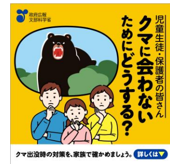
(児童生徒・保護者向け 静止画バナー広告)