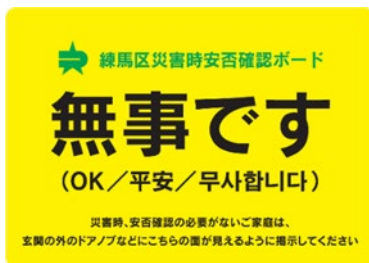
練馬区災害時安否確認ボード