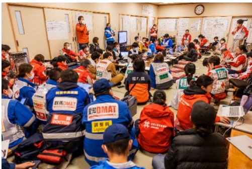
保健医療福祉調整本部の様子