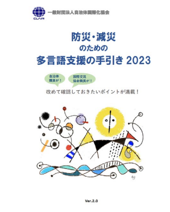
「防災・減災のための多言語支援の手引き」