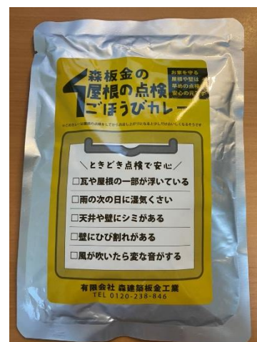
「屋根の点検ごほうびカレー」