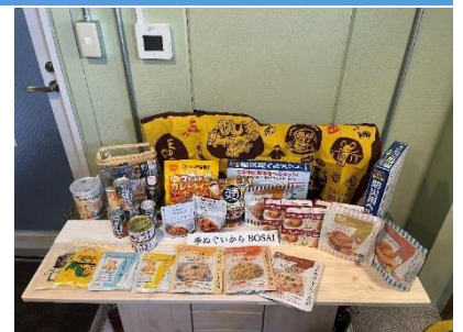
防災ソングをきっかけにした防災食試食会の実施