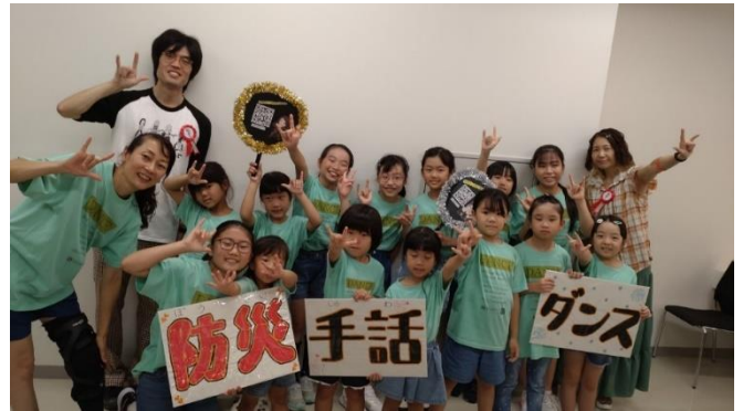
ダンス発表後のグループ写真