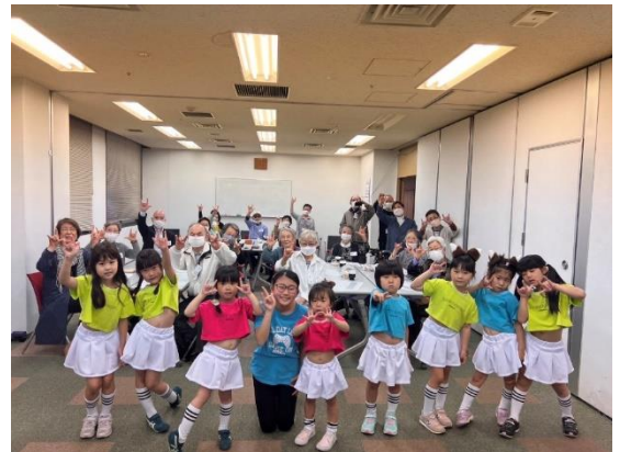
防災ソングに合わせた防災手話ダンス