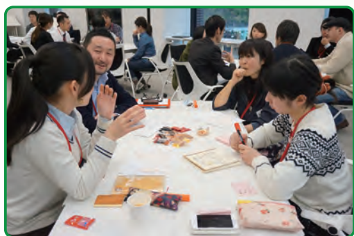
ワークショップのイメージ