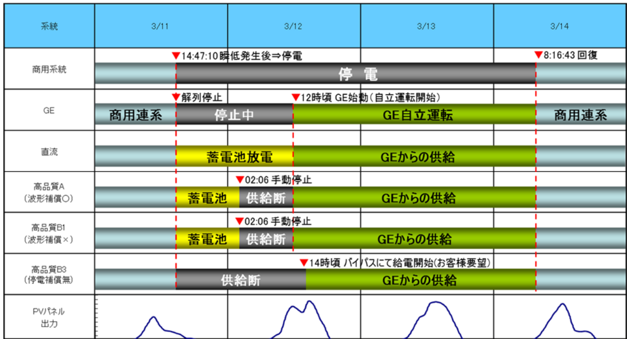
【東日本大震災時の運用/電力供給方法の推移】