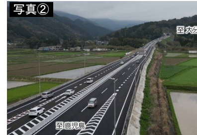
▲写真② 東九州道 清武南IC～日南北郷IC間(令和5年3月25日:開通時の状況)