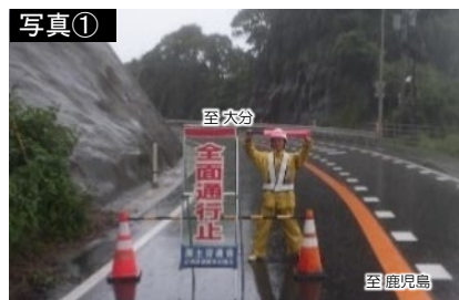
▲写真① 国道220号における規制(伊比井地区)(令和5年7月3日～4日)