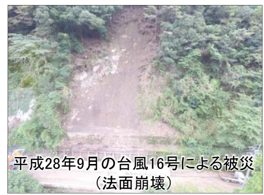
平成28年9月の台風16号による被災(法面崩壊)