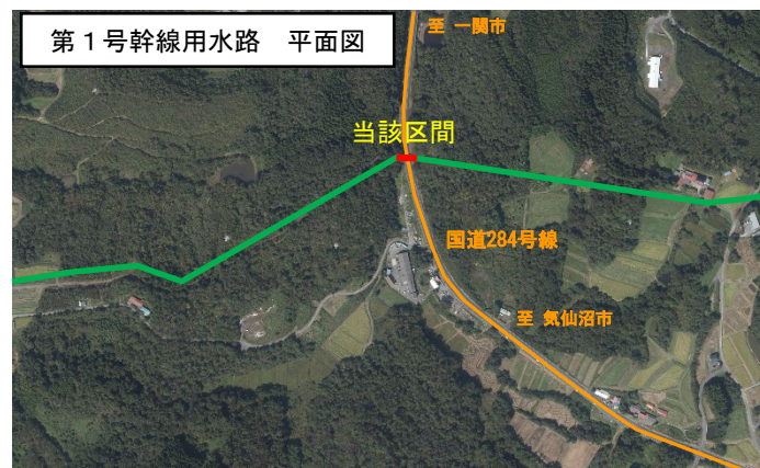
【当該区間の平面図と正面写真】

令和4年福島県沖を震源とする地震では、一関市において震度5強を観測したが、当該施設において被害は生じなかった。