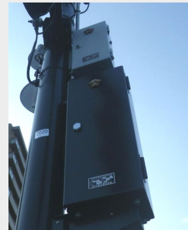
信号機電源付加装置