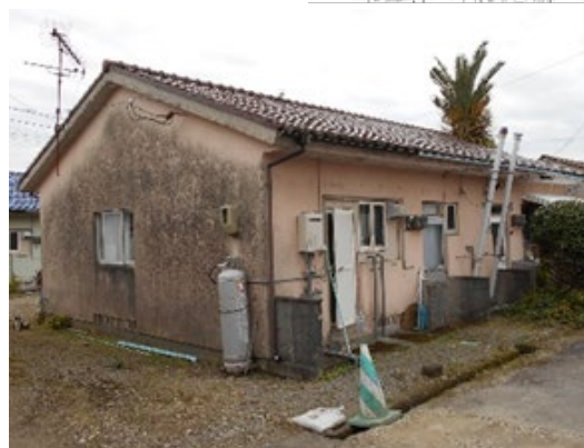
老朽化した公営住宅