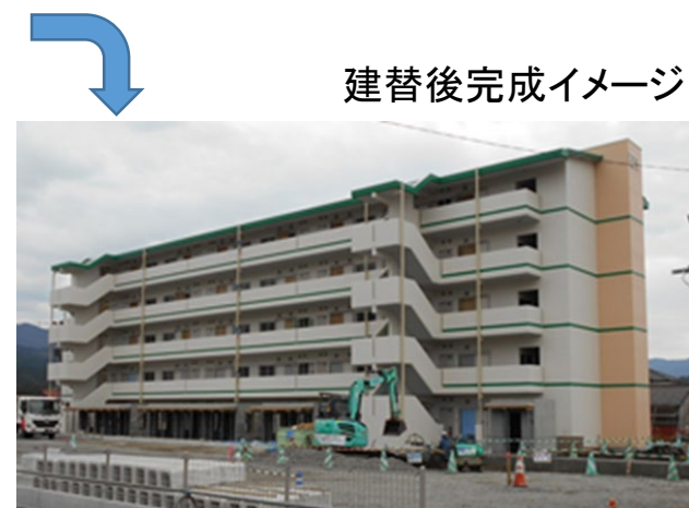
建替後完成イメージ