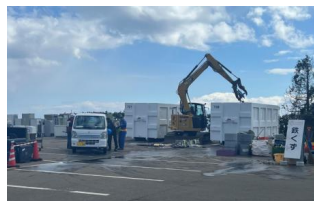
無償提供の実施例 石川県

令和6年能登半島地震が発生した際、能登町藤波運動公園の一部を廃棄物仮置き場等として無償提供しました。