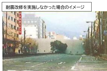
倒壊し避難路を塞いだ建築物