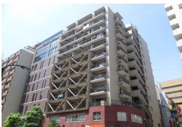
耐震改修を実施した建築物