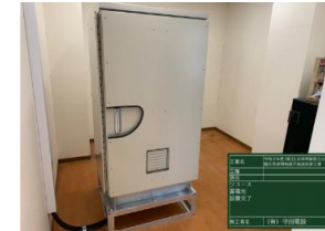
47kwhの大容量蓄電池を設置し、非常時の電源を確保