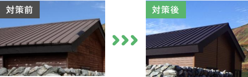
屋根の全面にアラミド繊維織物を設置するとともに、破損部分（垂木）を補修し、火山噴火に伴う噴石による人的被害の防止を図りました。