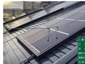
既存太陽光パネルを撤去し、21kw新設