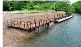
公共桟橋を整備し、樽前山の噴火で道路が寸断された際に動力船により避難することを可能にしました。