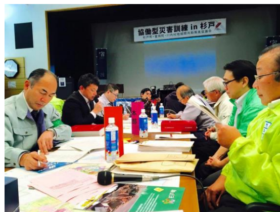
▲ICS リーダー研修の様子

システムを一元化し、対処すべき役割と部隊を明確にし、災害に対応するシステムである。その組織の5つの主要な機能は、指揮（Command）、実行（Operation）、計画（Planning）、後方支援（Logistics）、財務総務（Finance）から構成され、一元的な情報収集と指揮命令を行う現場指揮所を置くことで、近隣から参集した人材を組織化するのにも有効であり、グローバルスタンダードに使用されている。