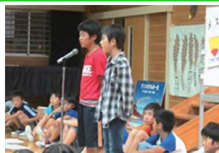
▲長崎大水害についての発表