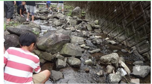
▲中島川にホタルを返す小学生