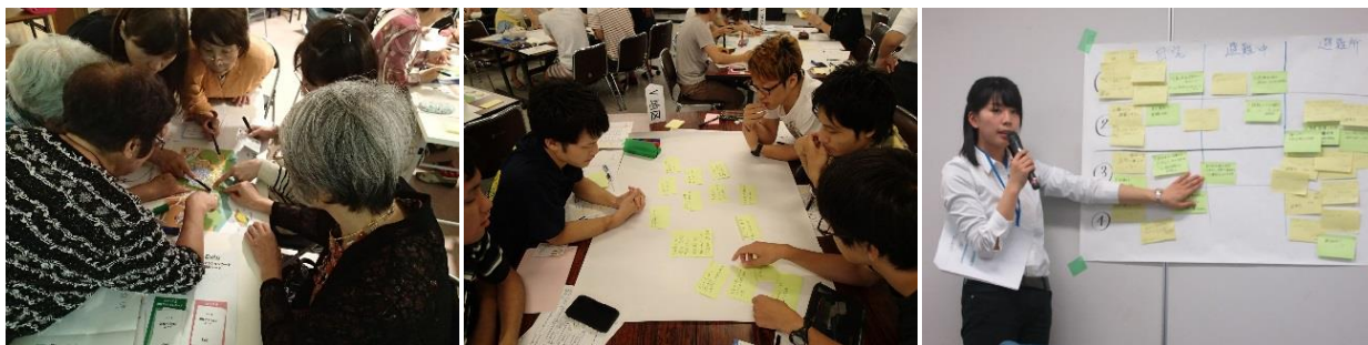
▲ワークショップ参加者の様子