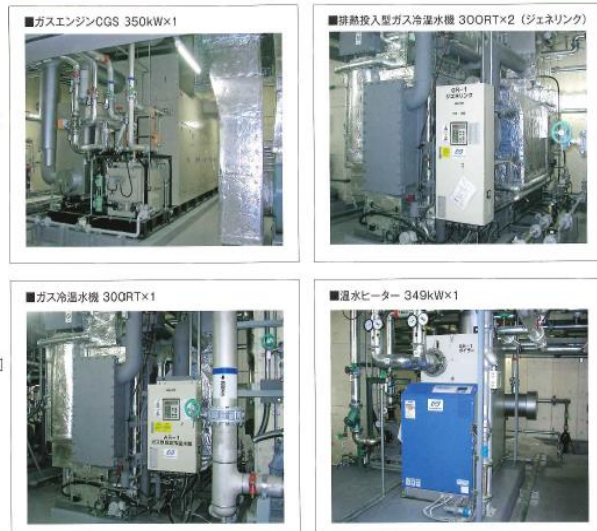
▲エネルギーサービス 設備概要