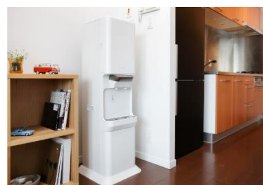
▲同社のウォーターサーバー