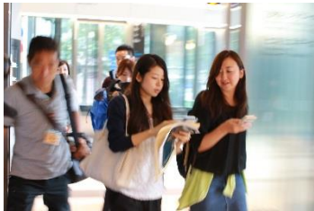
▲ 第1回参加者の訓練の様子