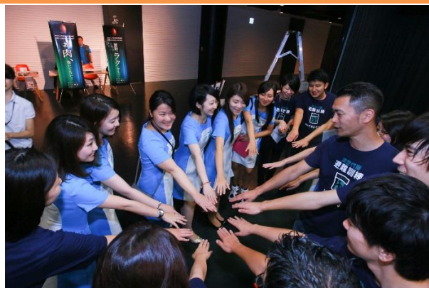
▲渋谷開催時の同社とボランティアスタッフ