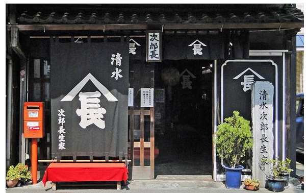
▲清水次郎長の生家