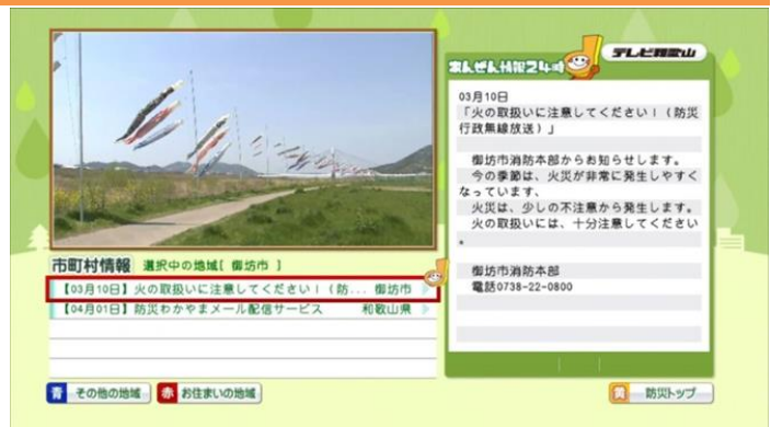
▲市町村防災情報画面