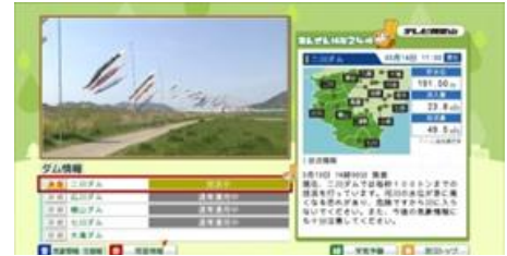
▲テレビで「ダム情報」を提供