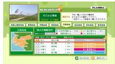
▲河川水位情報画面