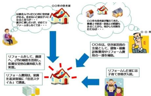
▲リバースモーゲージローンを利用した空き家対策