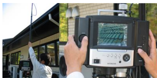
▲ポールカメラ診断の様子