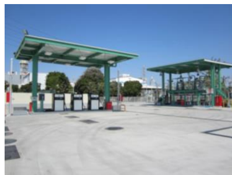
▲杉戸燃料備蓄基地の外観