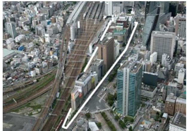
▲名駅南地区の位置（白線に囲まれたエリア）