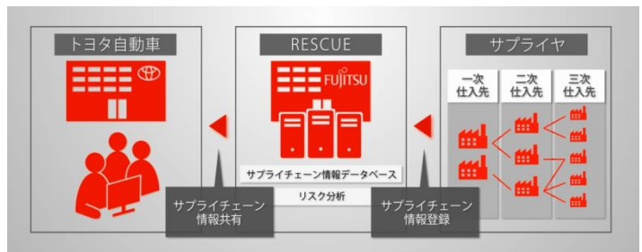
▲サプライチェーン情報データベースによる情報共有