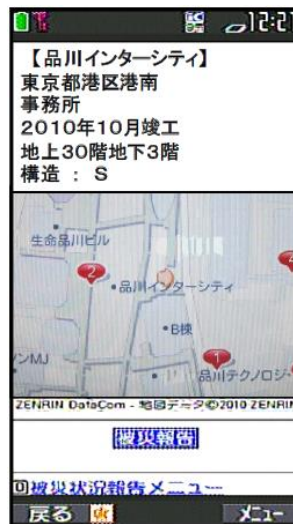
▲被害情報集約システムの「携帯 BCP」の携帯画面表示イメージ