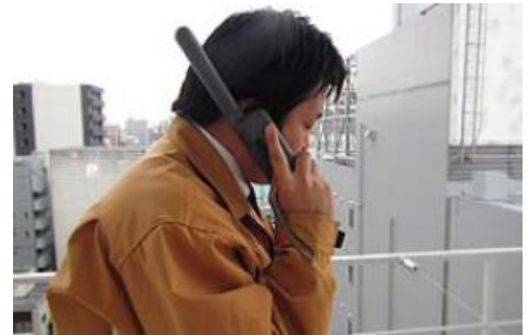
▲衛星携帯電話により顧客と連絡