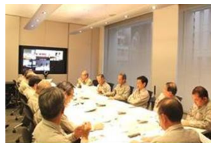
▲ 震災対策本部会議の様子