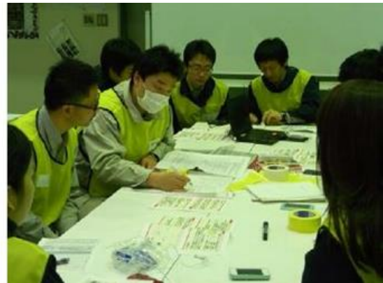
▲休日参集訓練において震災対策本部を本社に設置 ▲社員寮の一室で初動体制の立上げの確認