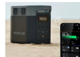
ポータブル蓄電池