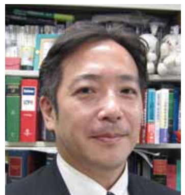
上智大学法科大学院教授 (国際取引法、金融法実務演習等)

勿論、法科大学院が提供できるものは、これに限られません。どのクラスでも、多様な可能性と高い志を持つ皆さんを、少人数教育でみっちり鍛えます。法科大学院は、皆さんが、将来、法律を武器に活躍するために自分を磨く場なのです。