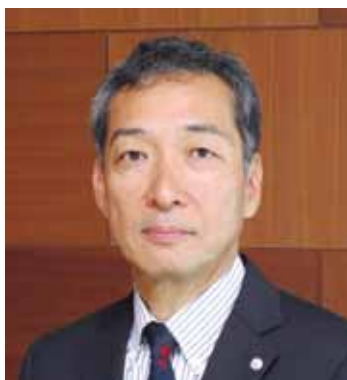
花王株式会社執行役員 (法務・コンプライアンス部門統括、情報システム部門担当)

企業は、すべてのステークホルダーとのwin-winの関係の中で、利益ある永続的な成長をめざして活動しています。しかし、ひとたびトラブルが発生すると、対応に要するエネルギーは膨大なものとなるため、企業法務においても、対処・