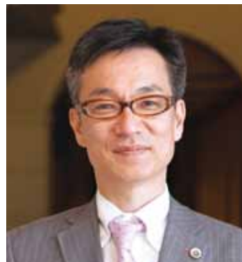
弁護士（弁護士法人あすなる・あすなる法律事務所） 関西学院大学大学院司法研究科教授 （ローヤリング、民事裁判実務、環境法演習等）

ロースクールは、社会との境目で、汗と涙と笑いを通して、法律家として一生使える基本的スキルと倫理観を生き生きと学ぶ場所でもあるのです。皆さん、ロースクールという「舞台」に立ってみませんか？