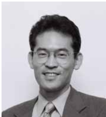
弁護士 (西村あさひ法律事務所)

当事務所は法科大学院出身者を第1期修了生から採用しており、2014年8月1日現在、法科大学院出身の弁護士が166名在籍しています。冒頭で述べたような法的サービスの提供のため、当事務所の若手