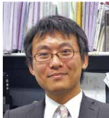
弁護士・ニューヨーク州弁護士・カリフォルニア州弁護士 （弁護士法人淀屋橋・山上合同） 神戸大学法科大学院非常勤講師（中国法） 京都大学法科大学院非常勤講師（渉外契約演習） 同志社大学法科大学院非常勤講師（アジア法、コーポレート・ガバナンス）

皆さんが法科大学院に入学され、実務の先端に触れてくれることを楽しみにしています。