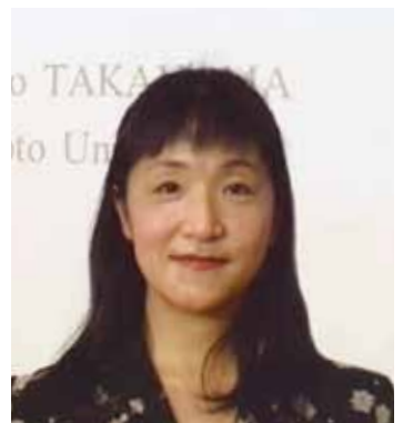
京都大学法科大学院教授（刑法） 国際刑法学会事務総長補佐

私は29歳まで外国で生活した経験がありませんでしたが、現在は国際刑法学会で役員を務め、世界各国の法律家に会っています。そこで思うのは、いくら英語が上手でも、専門分野の実力がなければ何にもならないということです。また、諸外国の人たちは英語が上手そうに見えて、意外に文法や発音の誤りを犯しているものです。日本で大学受験を経験した人のレベルならば、自信をもって情報発信してよいのです。ぜひ、多くの方々に日本の法制度の優れた点を学んでいただき、法律家として広く国際社会にはばたいて行ってほしいです。