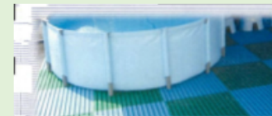
清掃しやすいスノコ