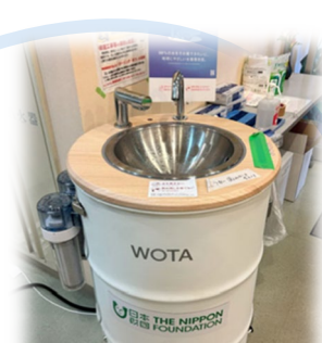
水循環型手洗いスタンド (志賀町)