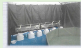
シャワースタンド