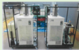
給湯ボイラシステム