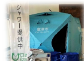
水循環型シャワー (珠洲市)