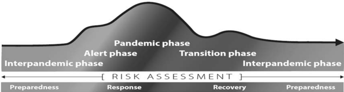
Figure 1. The continuum of pandemic phases a

新型インフルエンザウイルスの世界的な拡がりに応じて4段階とし、 新型インフルエンザウイルスの世界の平均的な流行状況を各国が理解するために使用するものとしている。