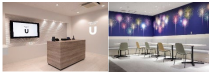
NAGAOKA WORKER 専用のコワーキングスペース