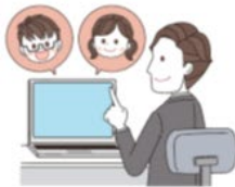
生徒との対話からの見取り