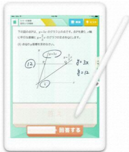
キュビナ使用イメージ