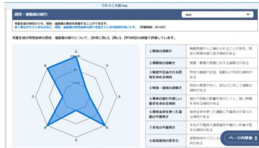
リタリコによる子どもの特性分析