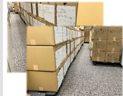
(備考) 日本パブリックアフェアーズ協会より引用。